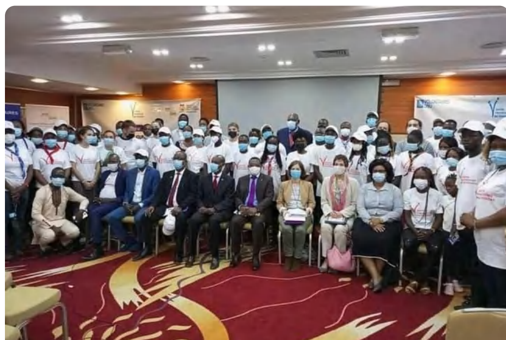
Journée internationale du volontariat (CSP, Bénin)