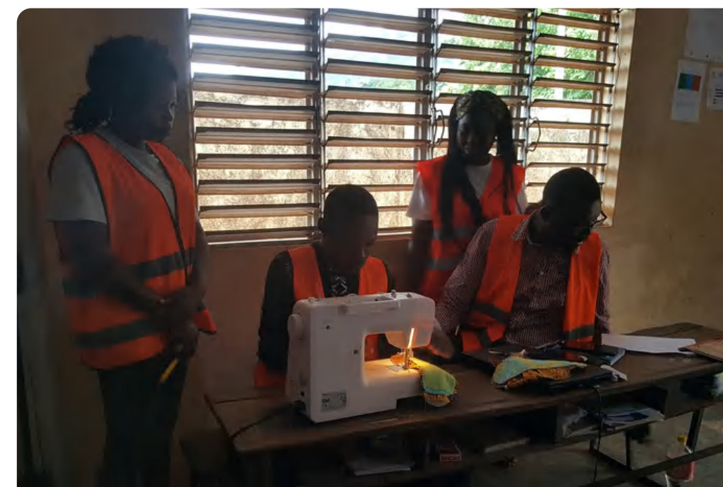
Atelier de fabrication de serviette hygiénique lavable (Dassa-zoumé, Bénin)