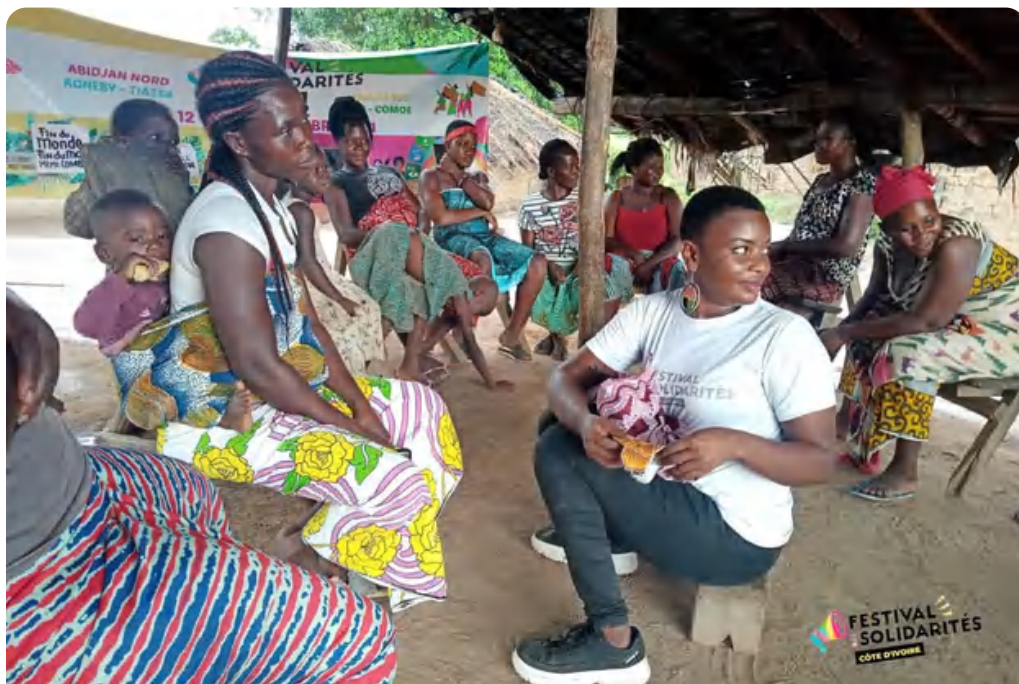
Sensibilisation sur l'hygiène menstruelle (Zimokonankro, Côte d'Ivoire)