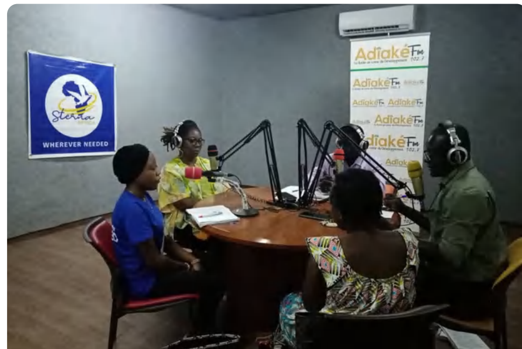
émission radio sur les violences basées sur le genre (Adiaké, Côte d'Ivoire)