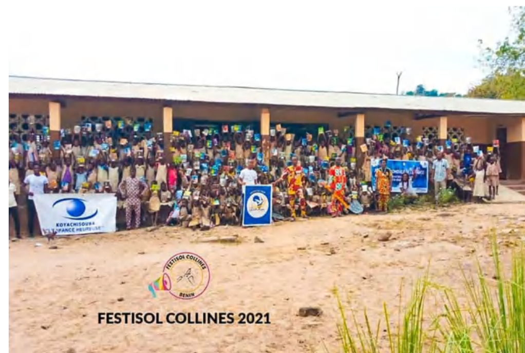
Distribution de Kits scolaires (Dassa-zoumé, Bénin)