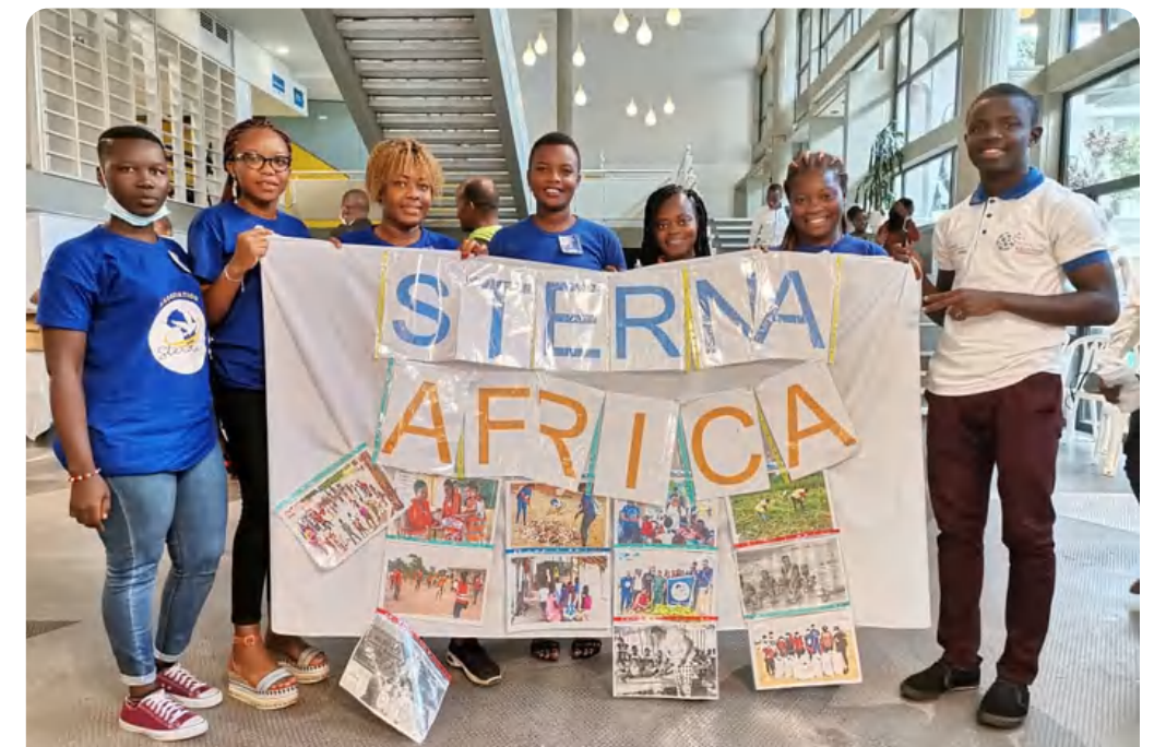
Journée du volontariat français (Institut français, Côte d'Ivoire)