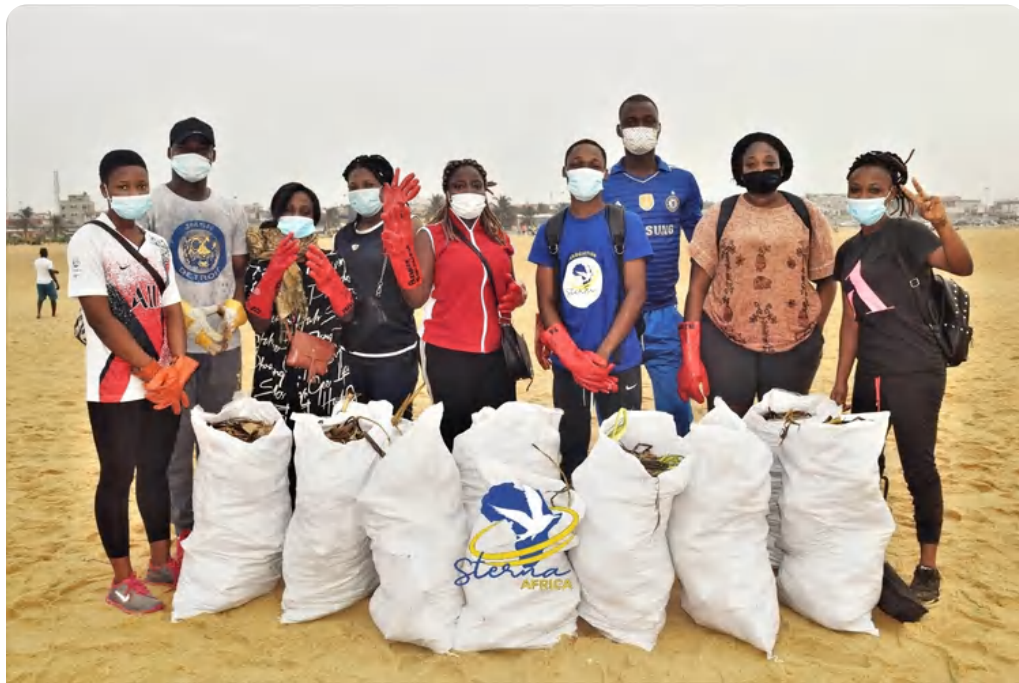
Sensibilisation et nettoyage de plage (fidjrossè, Bénin)