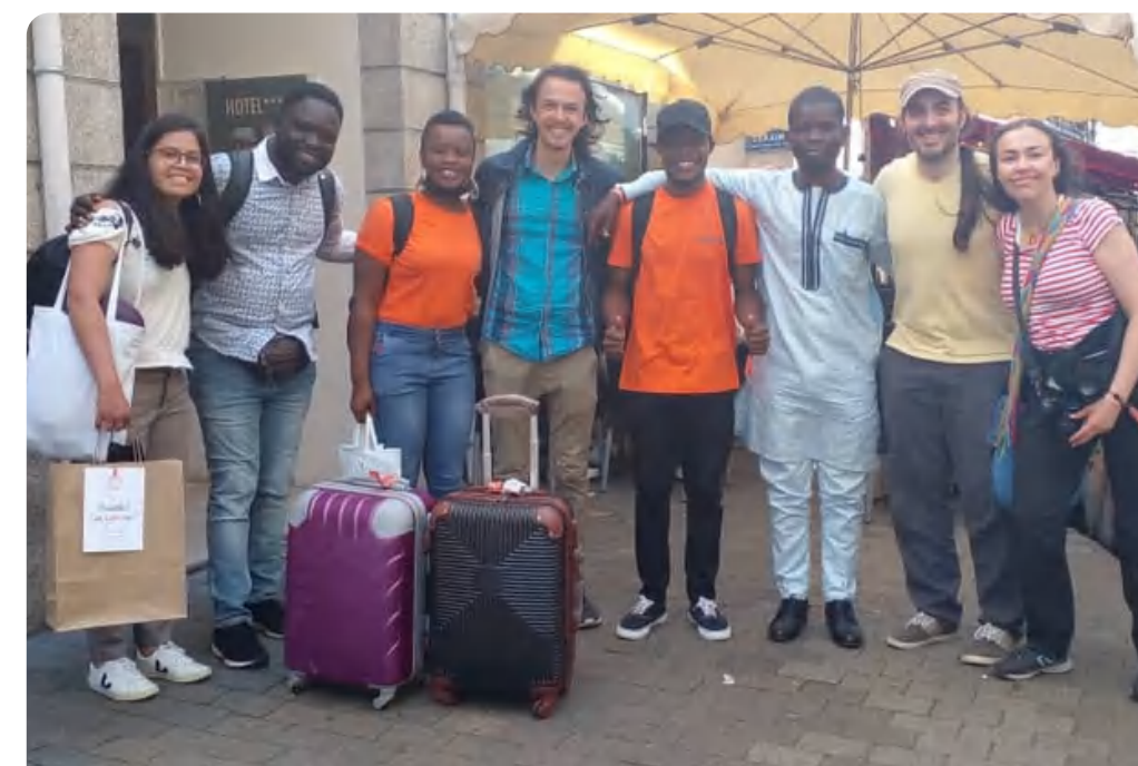
Université d'été (Nantes, France)