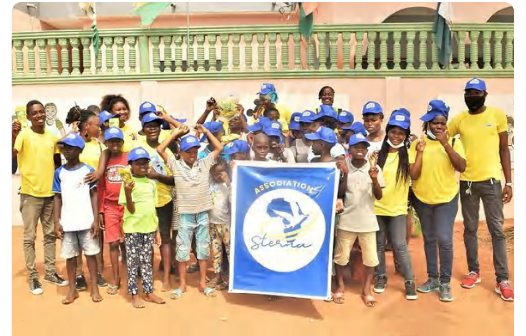
Déjeuner des démunis (ouidah, Bénin)