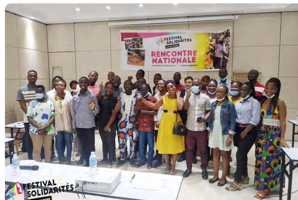
Rencontre nationale festival des solidarités (Vridy, Côte d'Ivoire)