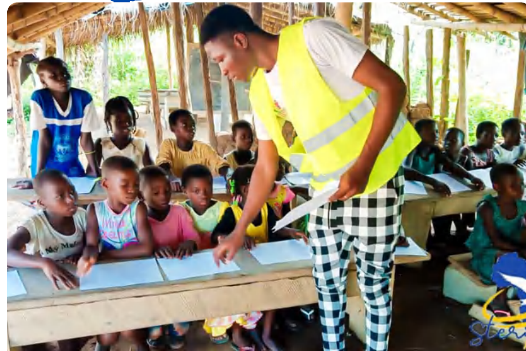
Chantier de Solidarité Internationale (Yamoussoukro, Côte d'Ivoire)