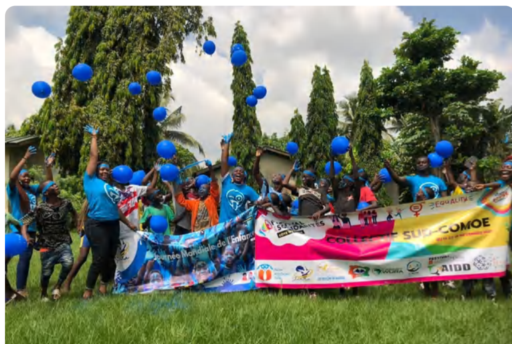
Journée mondiale des enfants (Abobo, Côte d'Ivoire)